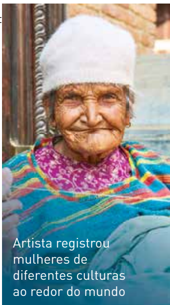
Artista registrou mulheres de diferentes culturas ao redor do mundo