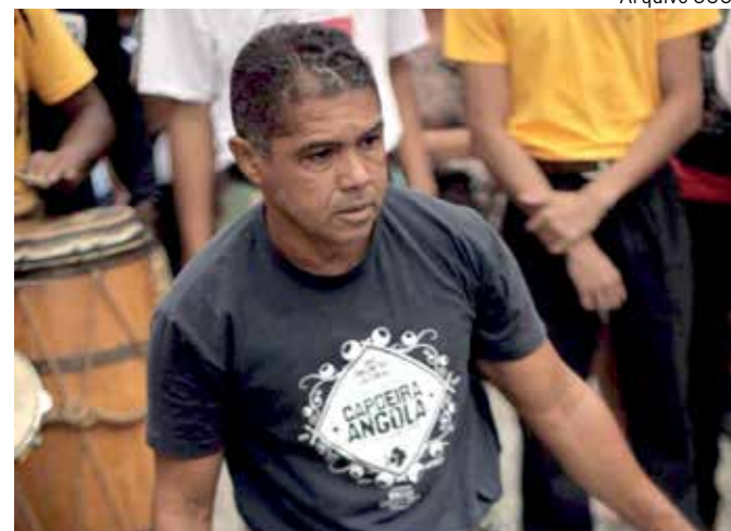
Mestre Peixe deixa legado para a Capoeira Angola