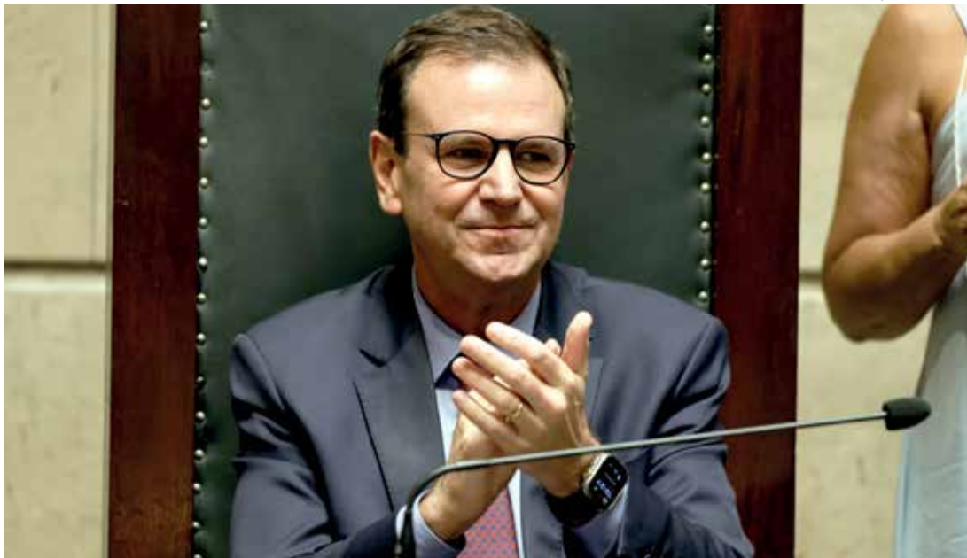
Prefeito do Rio de Janeiro, Eduardo Paes, durante cerimônia de posse