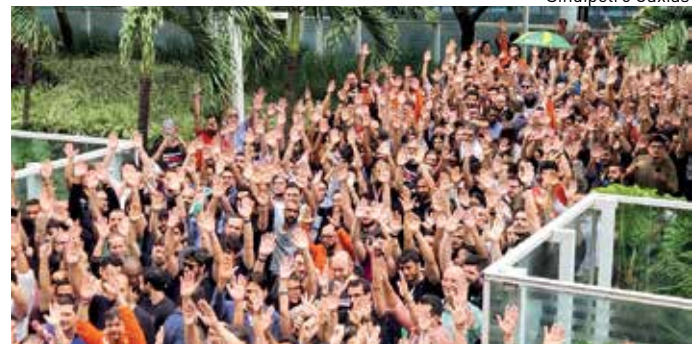
Petroleiros realizam ato em frente ao Edisen, no centro do Rio